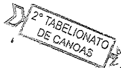
MATEUS NUNES DOS SANTOS GIUNCIONE INCORPORAÇÕES LTDA