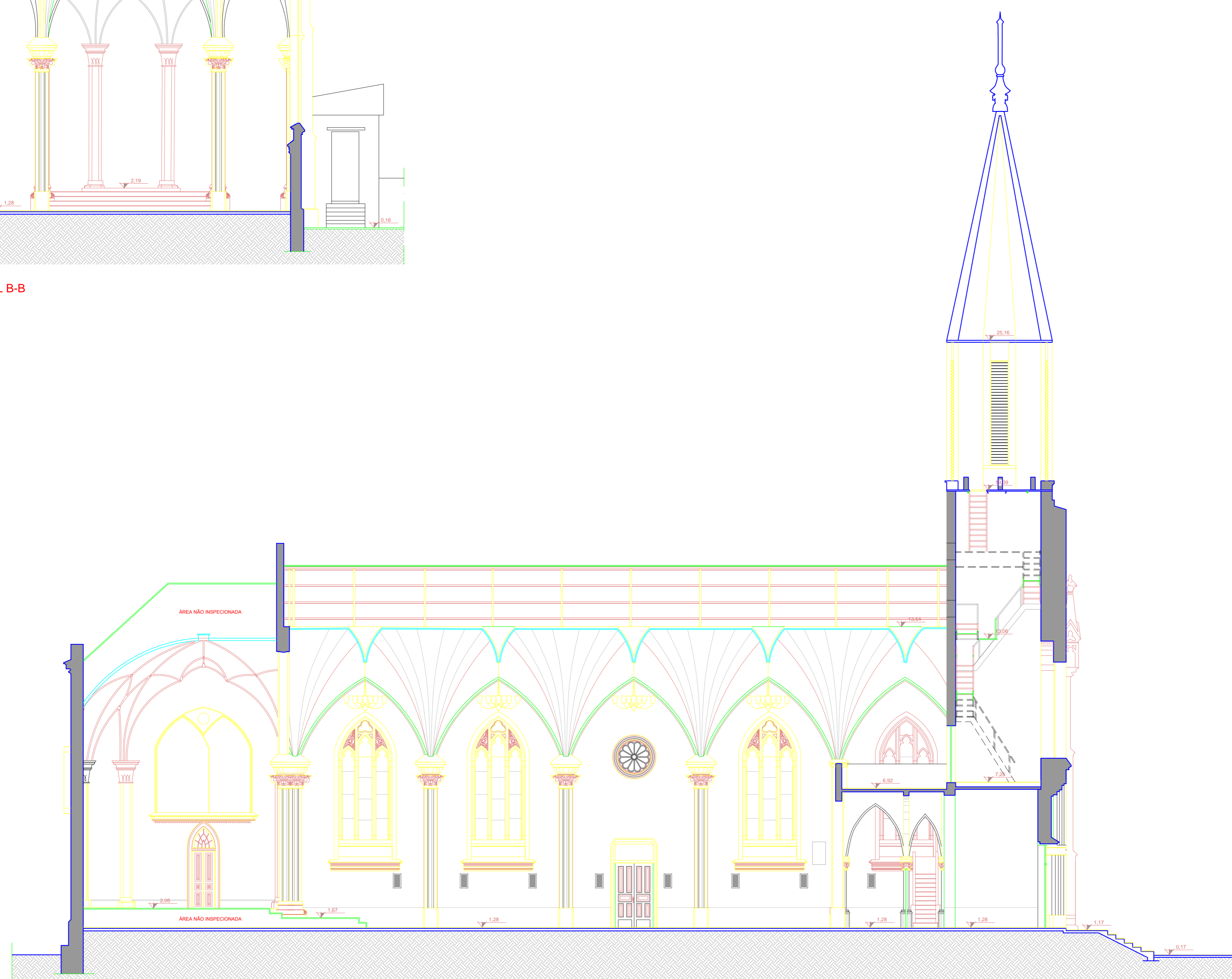
CORTE LONGITUDINAL A-A ESCALA 1/100