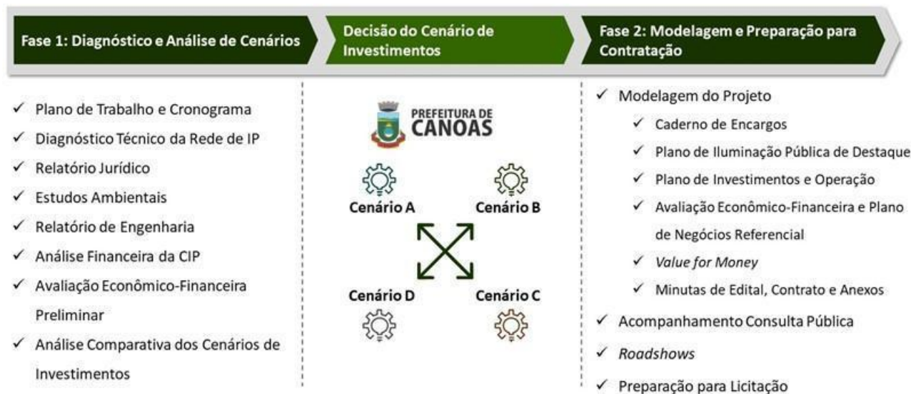
Figura 1 - Fases do Projeto

O Município de Canoas, no Rio Grande de Sul, que conta com cerca de 31 mil pontos de luz, foi selecionado para participação nesta iniciativa. Para o projeto que será executado em Canoas, as atividades serão realizadas em duas fases: a Fase 1 contemplando o diagnóstico do cenário atual e a Fase 2 contendo a modelagem do projeto e preparações para contratação.