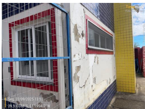
Foto 04- EMEI Vereador Alcy Paulo de Oliveira - pintura