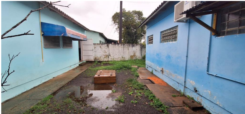
Foto 01- EMEI Vó Inezinha- pintura externa