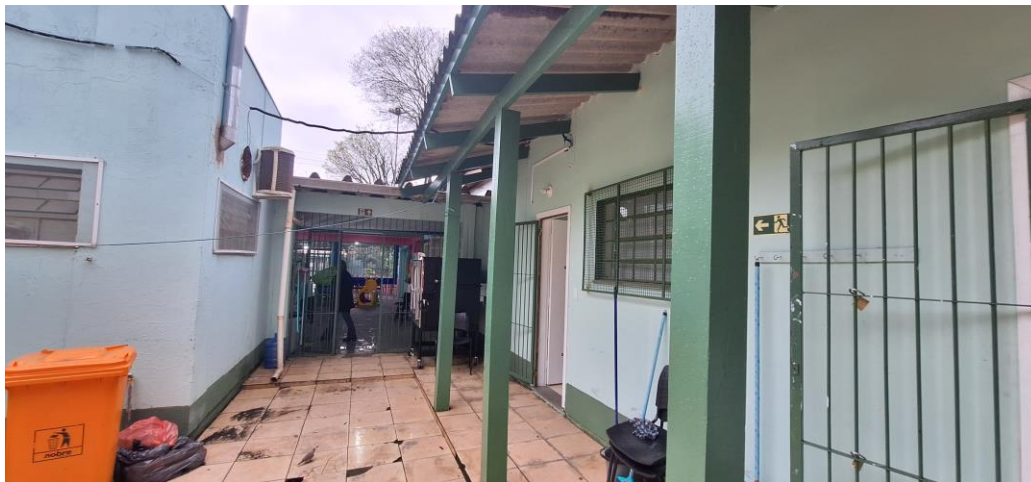
Fotos 05- EMEI Pingo de Gente- Piso externo