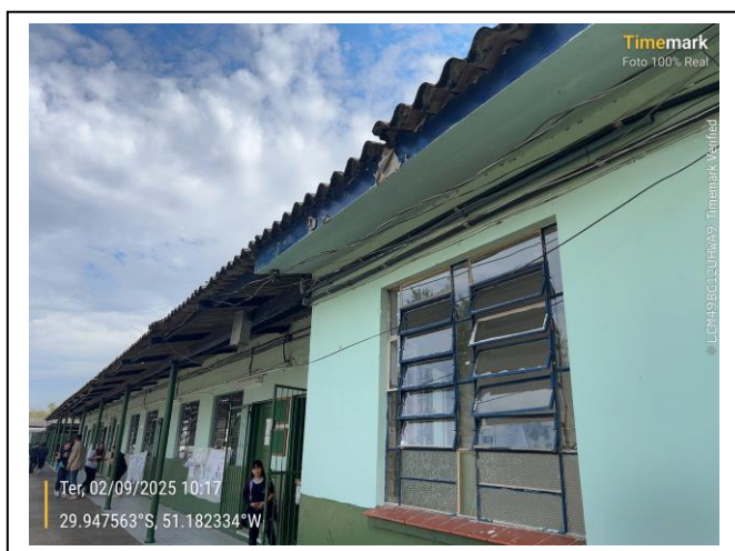
Fotos 06- EMEF Barão de Mauá- Troca de Telhas

Para algumas escolas está prevista a limpeza das redes de esgoto. E para algumas delas a substituição das telhas da cobertura e rufos.