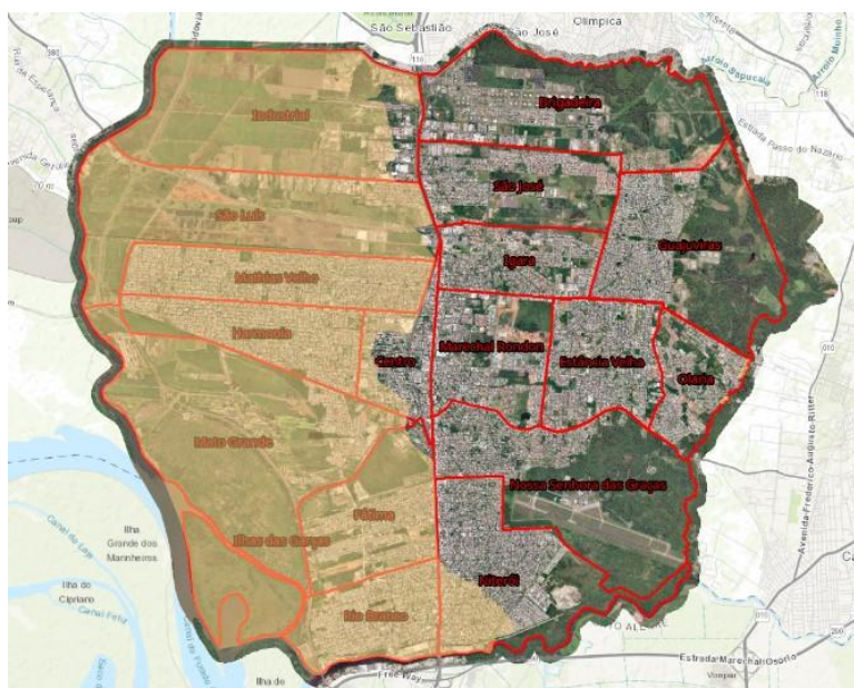
Mapa da cidade com mancha de inundação