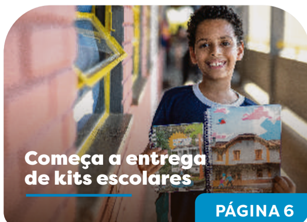
Ilustração: Ewerton "Pitty"