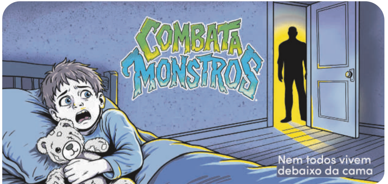
Ilustração: Ewerton "Pitty"

O combate ao abuso de crianças e adolescentes e à pedofilia ganhou um importante reforço em Canoas com o lançamento da campanha Combata Monstros. A iniciativa, desenvolvida em parceria pelas secretarias de Comunicação e de Educação, busca ampliar a conscientização, orientar educadores e famílias e fortalecer a rede de