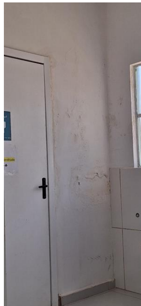
Imagem entrada sanitário

Conforme descrito, será necessário contratar empresa especializada em arquitetura e/ou engenharia para reforma da UBS Fátima.