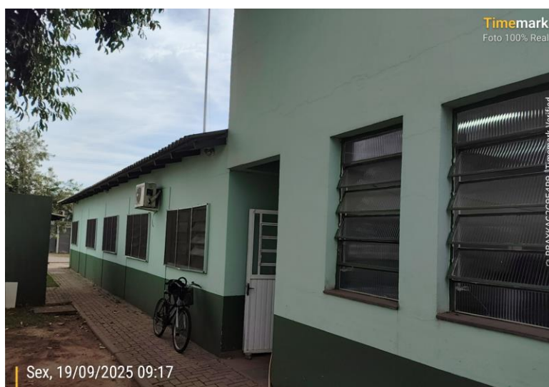
Imagem acesso lateral

Também foi detectado que na porta de entrada lateral há um problema de entrada da água da chuva, neste caso propomos uma cobertura sobre a área da entrada e um acréscimo no sistema de drenagem junto a este espaço.