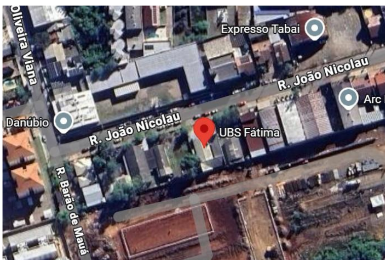
Foto aérea UBS Fátima